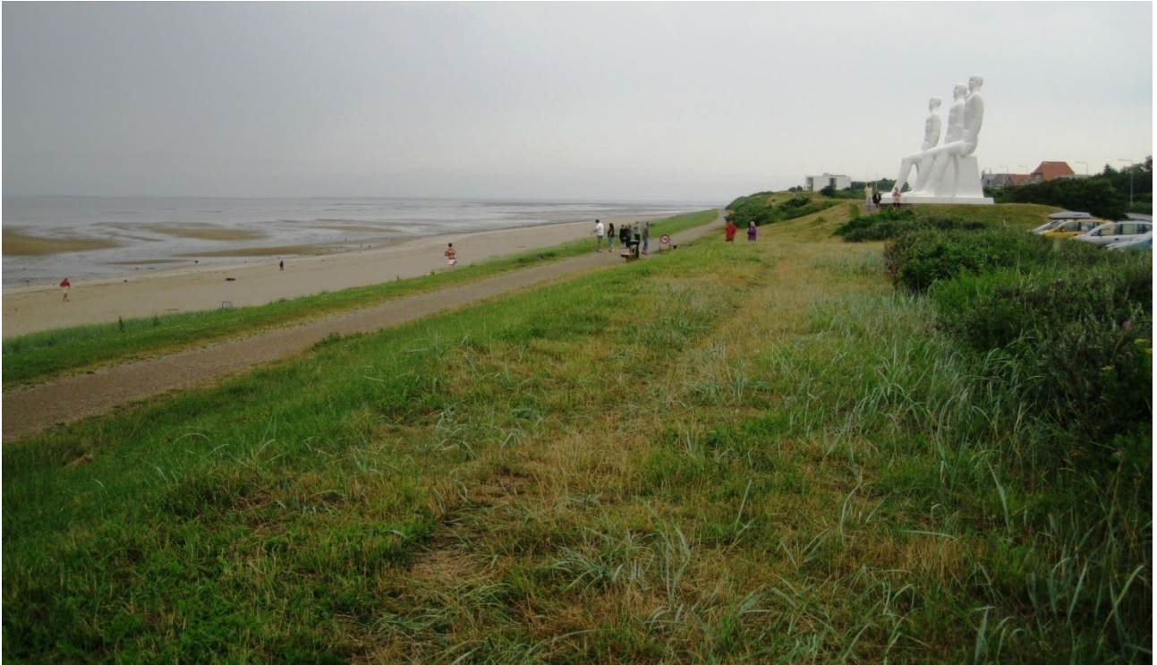
Stranden ved Mennesket ved Havet

hvid beton. Der kan køres til stranden via Sædding Strandvej, hvor der findes parkeringspladser langs med vejen på hele strandens strækning. På parkeringspladsen ved Mennesket ved Havet findes toiletfaciliteter. Den brede sandstrand adskilles fra byen af et stort grønt areal, der medvirker til en hyggelig stemning ved den bynære strand.