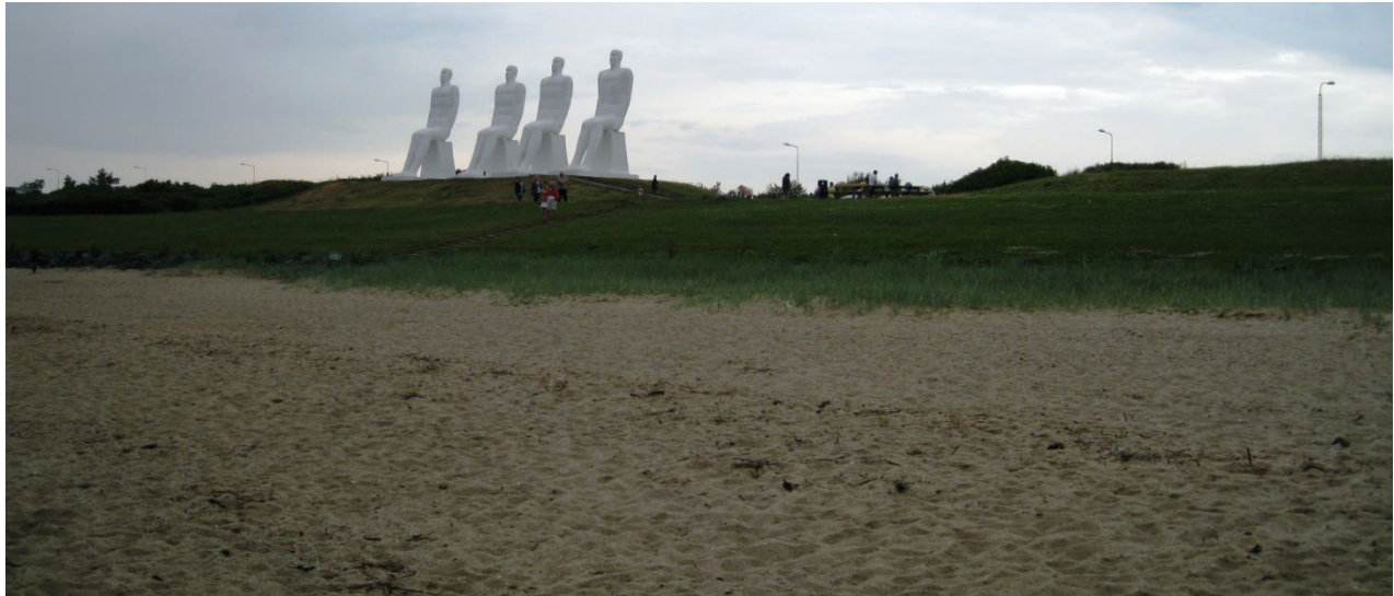
Mennesket ved Havet