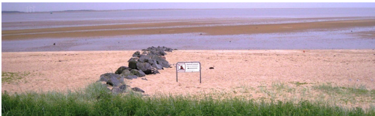
Ved Mennesket ved Havet

skade de badendes sundhed, vil kommunen varsle om dette ved at hejse rødt flag på stranden (se oversigtskort) og på kommunens hjemmeside: Badevands hjemmeside .