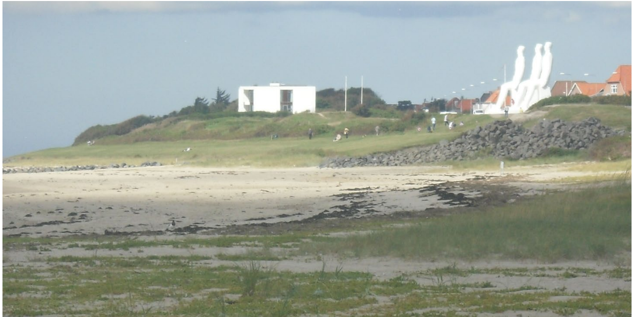
Mennesket ved Havet